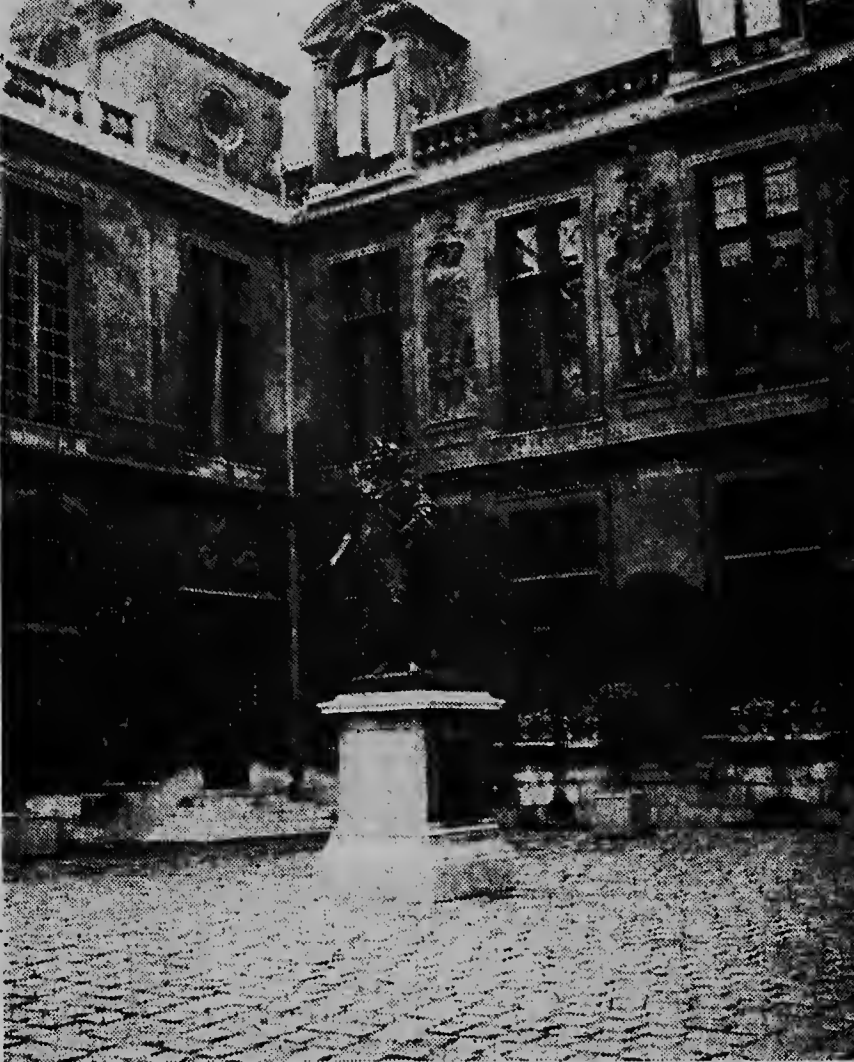
Esaki ta un di e diferente edificacion antiguo cu ta worde restaura na Paris, ta Hotel Carnavalet den centro di e sector Marais na unda Madame de Sevigne tabata bina den siglo 17 y cu awe ta Musee de la Ville de Paris.

En el corazon del Marais, subsiste todavia un baluarte de tranquilidad, de grandeza y de verdor, que el tiempo no ha llegado a destruir. Es la Plaza de los Vosgos, Lugar de tomoos, una dependencia del Palacio de Tournelles, destruido por orden de Catalina de Medicis, al ocurrir la muerte del rey Enrique II en liza celebrada en el lugar con el condestable ingles Montgomery y al celebrarse una boda real. Hoy en dia la Plaza es el paraíso de los niños que juegan en sus jardines embellecidos por tres hileras de arboles y limitados por los arcos graciosos que cubren el paseo magnifico de casas de ladrillo rojo y piedra blanca, construidas en el siglo XVII para el mundo de la elegancia de los tiempos de Luis XIII y Luis XIV. Este rincon apacible, en su tiempo domicilio de Victor Hugo, representa para el arquitecto Albert Laprade, Director de los trabajos del Marais, el